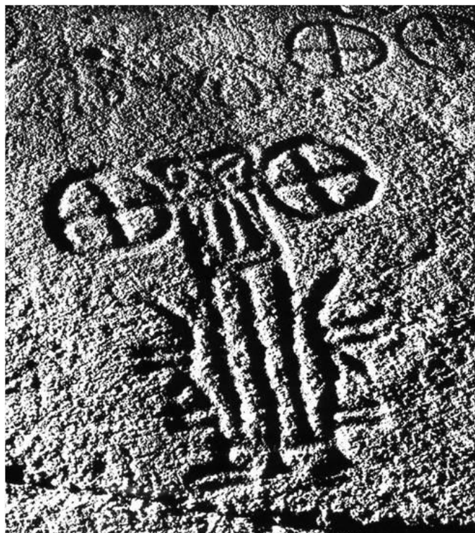
Vagnsristning med två hästar i märkligt snedperspektiv i Frännarp, Skåne. Denna unika håll har inga andra tydliga figurer än de tio vagnarna, med undantag av några få små hjulfigurer och några skålgropar.

Det finns en social företeelse med djupa indoeuropeiska traditioner ända från veda-kulturen i Indien. Den protoindoeuropeisk (PIE) termen bör ha varit *koryos . Den består i ungdomliga band av överklasskrigare, vars initiation till vuxenlivet förutsätter genomförda brutala angrepp på omvärlden för att röva och plundra. Det kan gälla boskapsrov, stöld av hästar och kvinnorov. Banden kan liknas vid vargflockar och vill också likna vargar (ulvar) och stora bitska hundar. De var inte osannolikt att det var med sådana rövarband indoeuropeiska stammar vann Europa en gång. En reminiscens av detta finns i samma kulturer som åberopats ifråga om kontinuitet i indoeuropeisk religion, både i