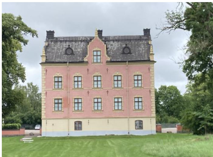
Skånelaholms slott sett från sjösidan.

Egendomen är känd från Magnus Ladulås tid och benämns i äldre tider Scanald, ibland Skånella, men någon förklaring till namnet tycks inte finnas. Större egendo-