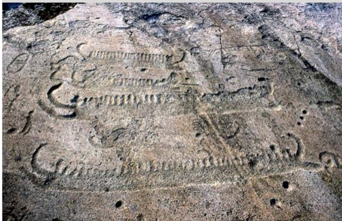
Typiska skepp utan målning från yngre bronsålder ca 1000f.Kr. vid Tanum, Bohuslän.

faktiska krigarband med sådana symboler (hos oss t.ex. ulfhednar och Odins einherjar). Den gemensamma bakgrunden bör vara en anknytning till himmsgudens aktiva aspekt . De är hans elit på jorden. Här skulle bronsålderns rakknivar kunna vara en slags medaljer från initiationen av de unga elitförbanden. I deras gravar garanterar de en roll i den främsta krigar-gudens eviga följe också efter döden. Också på dessa rakknivar avbildas olika typer av båtar som standard.